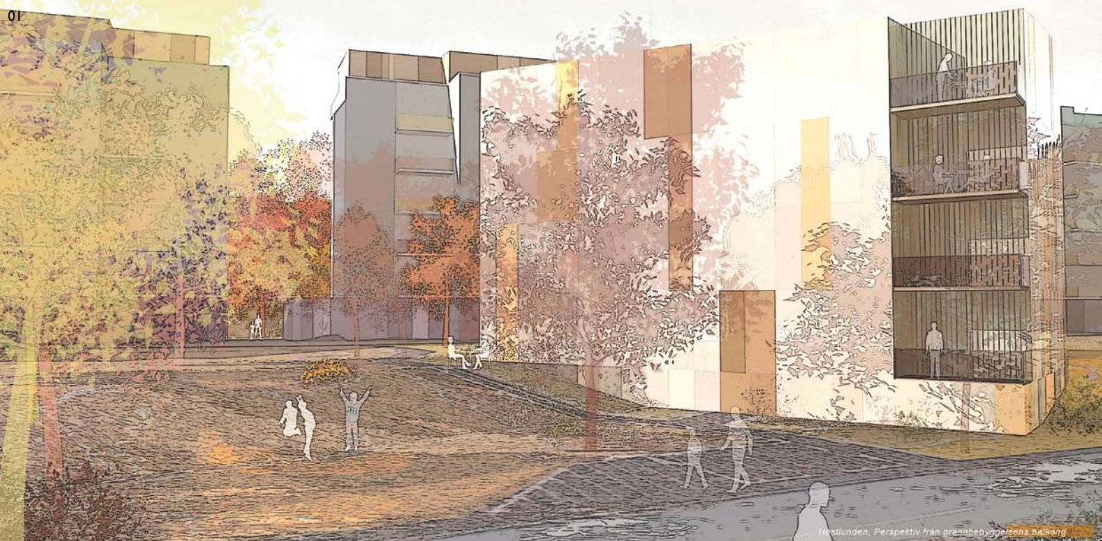
01 Höstlunden, Kvarteret Fältet, Solna Perspektiv från grannbebyggelsens balkong. Visionsbild © LINK Arkitektur.